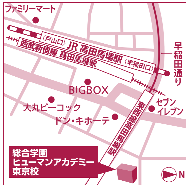
🚶 JR「高田馬場」駅 早稲田口より徒歩3分