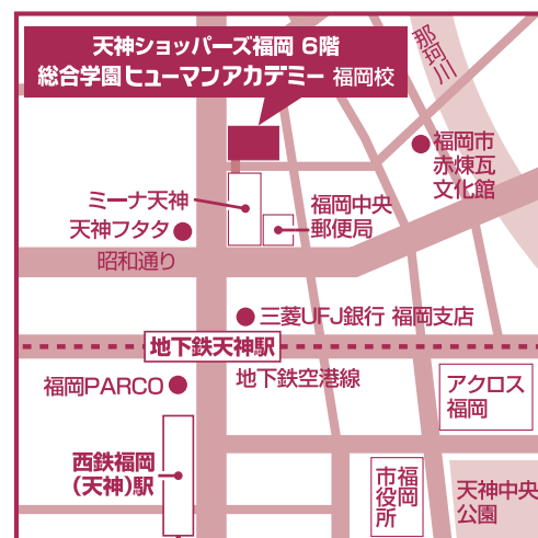
総合学園ヒューマンアカデミー 福岡校 入学事務局

〒810-0001 福岡県福岡市中央区天神4-4-11 天神ショッピング福岡6階 ☎0120-49-1055 FAX 092-725-2413 https://ha.athuman.com/ [E-mail] go@athuman.com